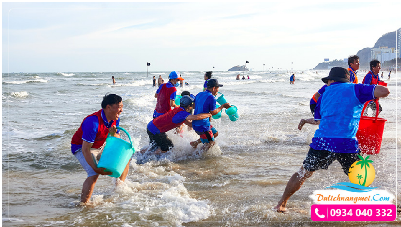
Những trò chơi teambuilding vui nhộn dành cho đội nhóm