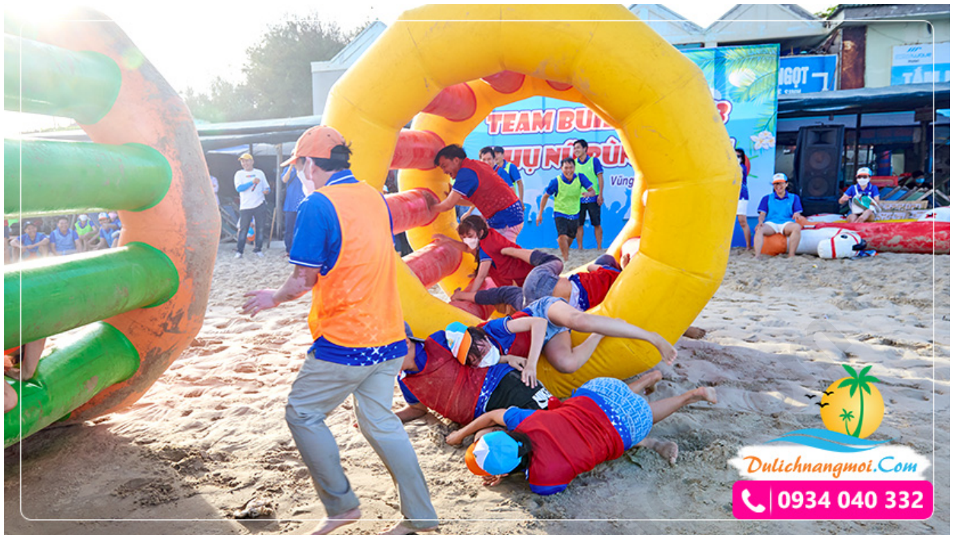
Chương trình team building sáng tại Vũng Tàu