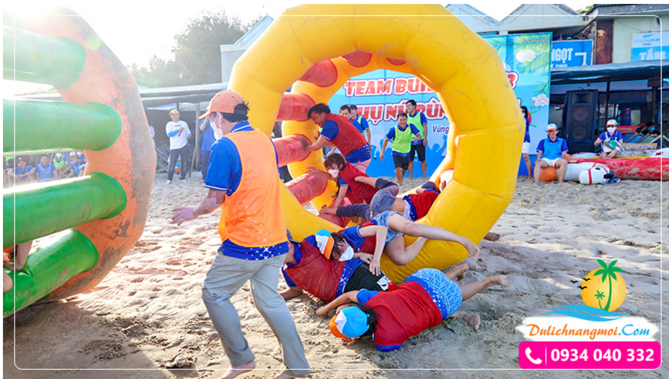
Chương trình team building sáng tại Vũng Tàu