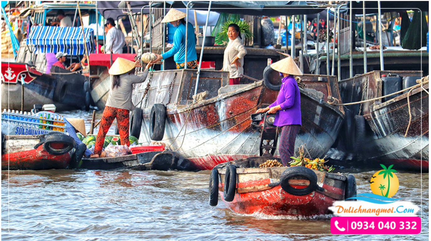
Khám phá văn hóa chợ trên sông (chợ nổi)

Trải nghiệm trở thành những người nông dân Nam Bộ trong trang phục áo ba ba tham gia tát mương bắt cá (Chi phí ngoài chương trình). Cá bắt được sẽ được chế biến thành các món ăn theo phong cách ẩm thực "khẩn hoang Nam Bộ".