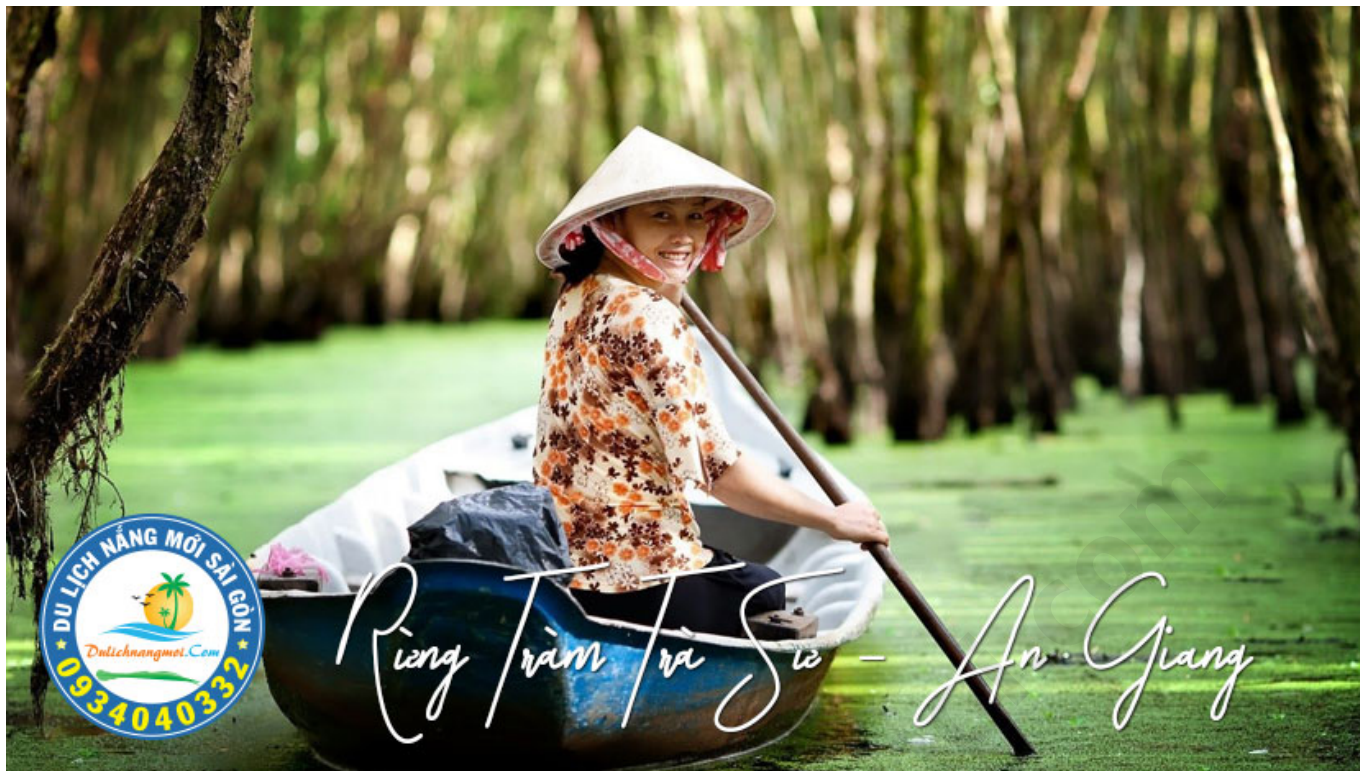
Cô gái chèo thuyền đưa khách tham quan rừng Trà Sư