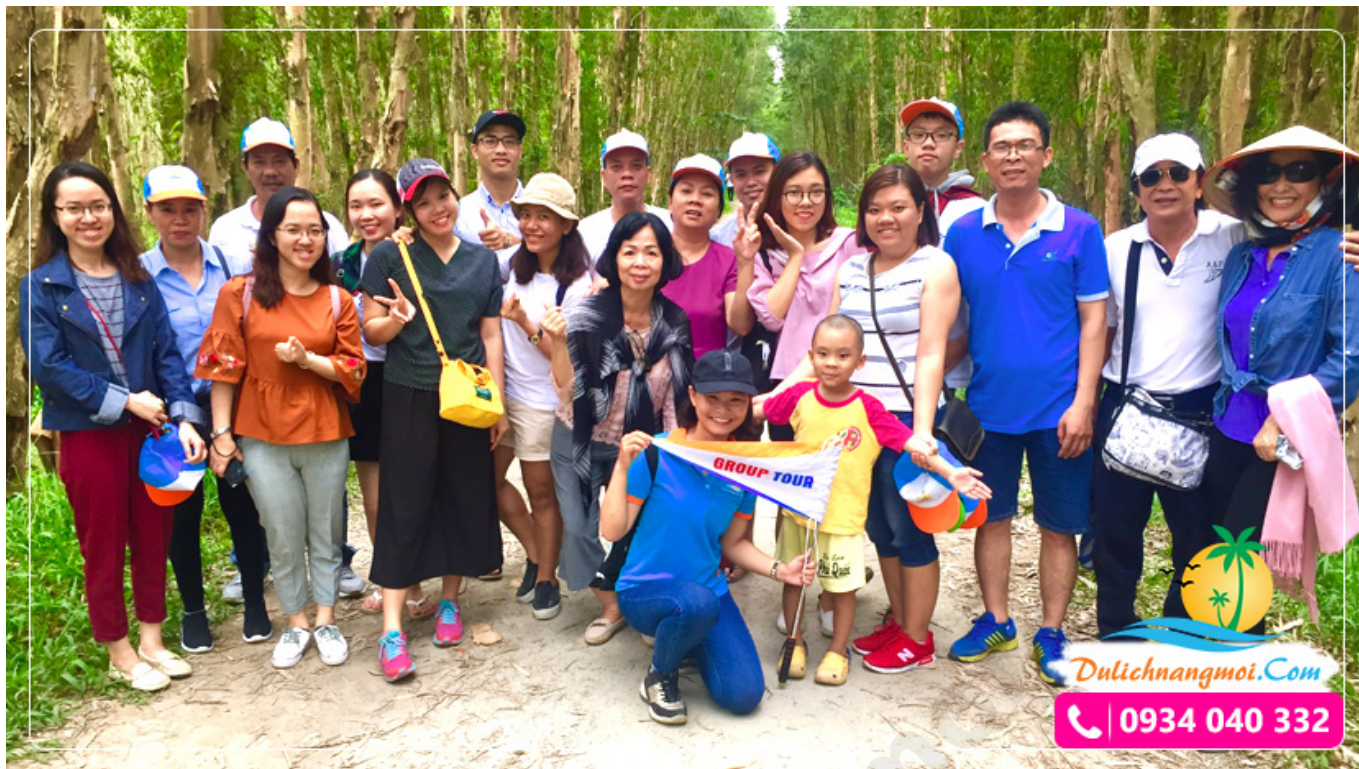
Du khách chụp ảnh lưu niệm tại rừng Tràm Trà Sư - An Giang